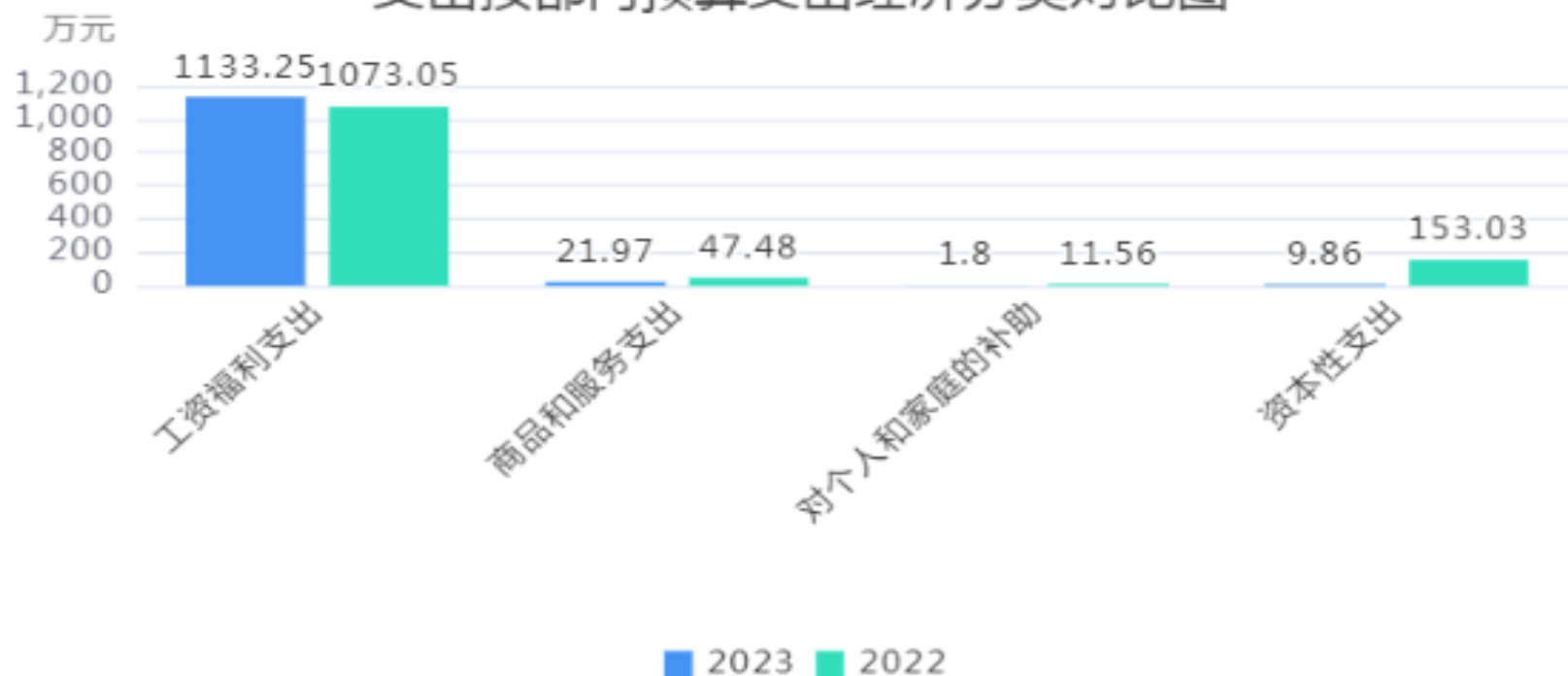
支出按部门预算支出经济分类对比图