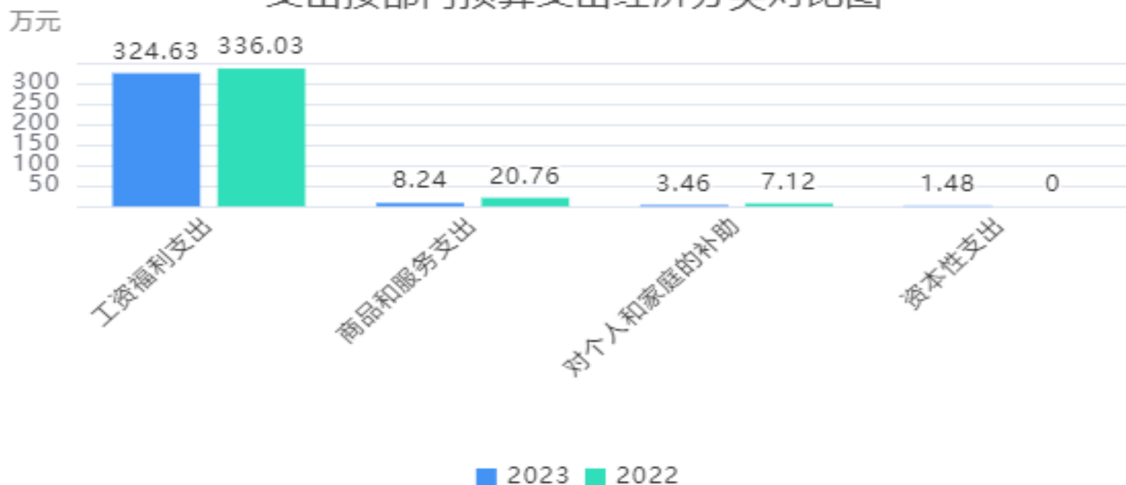
支出按部门预算支出经济分类对比图