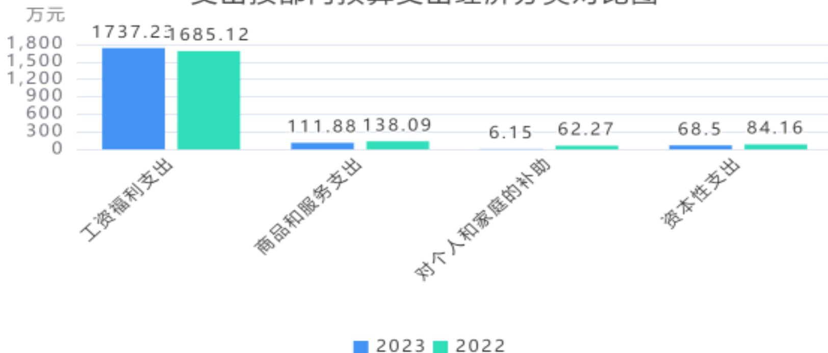
支出按部门预算支出经济分类对比图