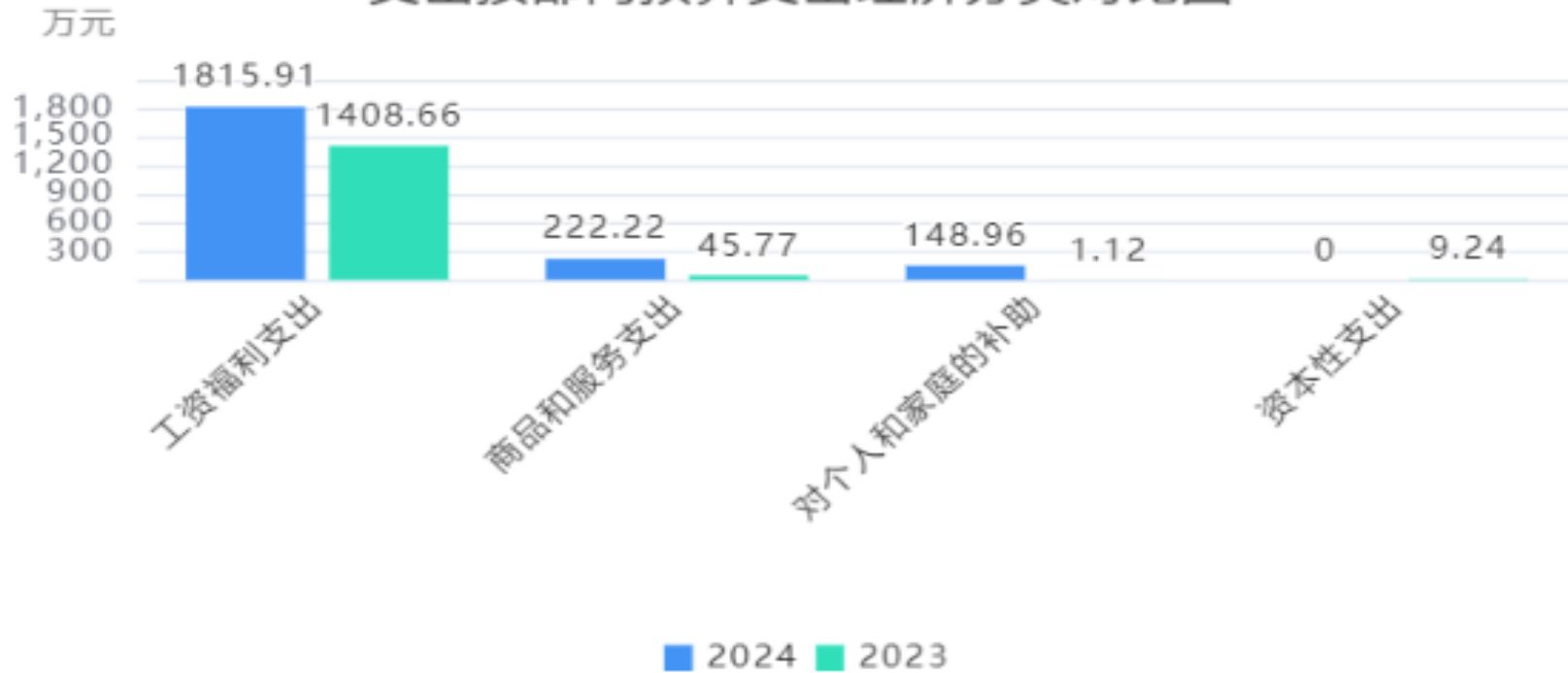
支出按部门预算支出经济分类对比图