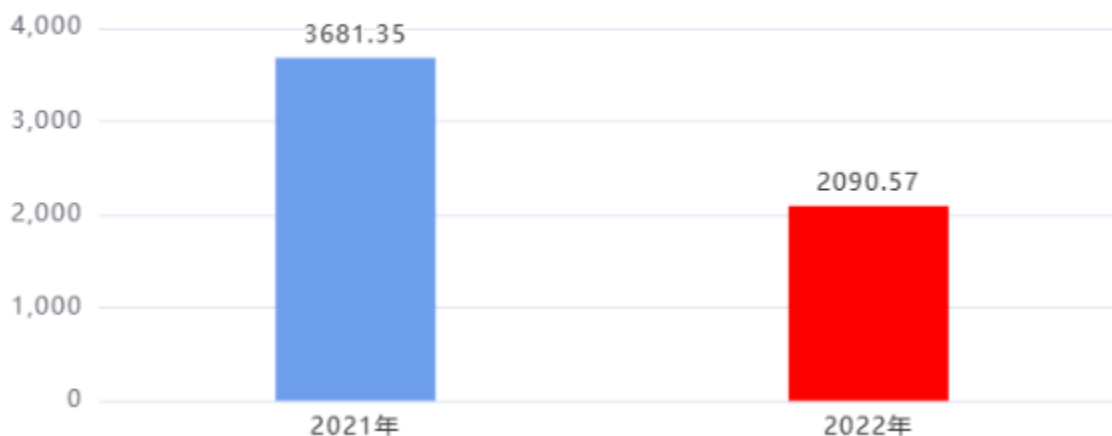
财政拨款支出对比图 (单位：万元)

2022年度一般公共预算财政拨款支出年初预算2,649.27万元，支出决算2,090.57万元，完成年初预算的78.91%，占本年支出合计的98.03%。与上年相比，财政拨款支出减少1,590.78万元，下降43.21%，下降的主要原因是：年初项目执行未付款及相关公积金未补缴。